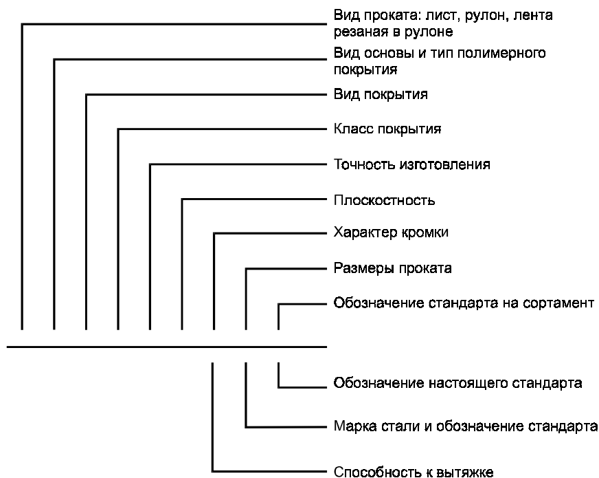
Схема условных обозначений проката с полимерным покрытием

Примечание — При отсутствии какого-либо из параметров его выбирает предприятие-изготовитель.